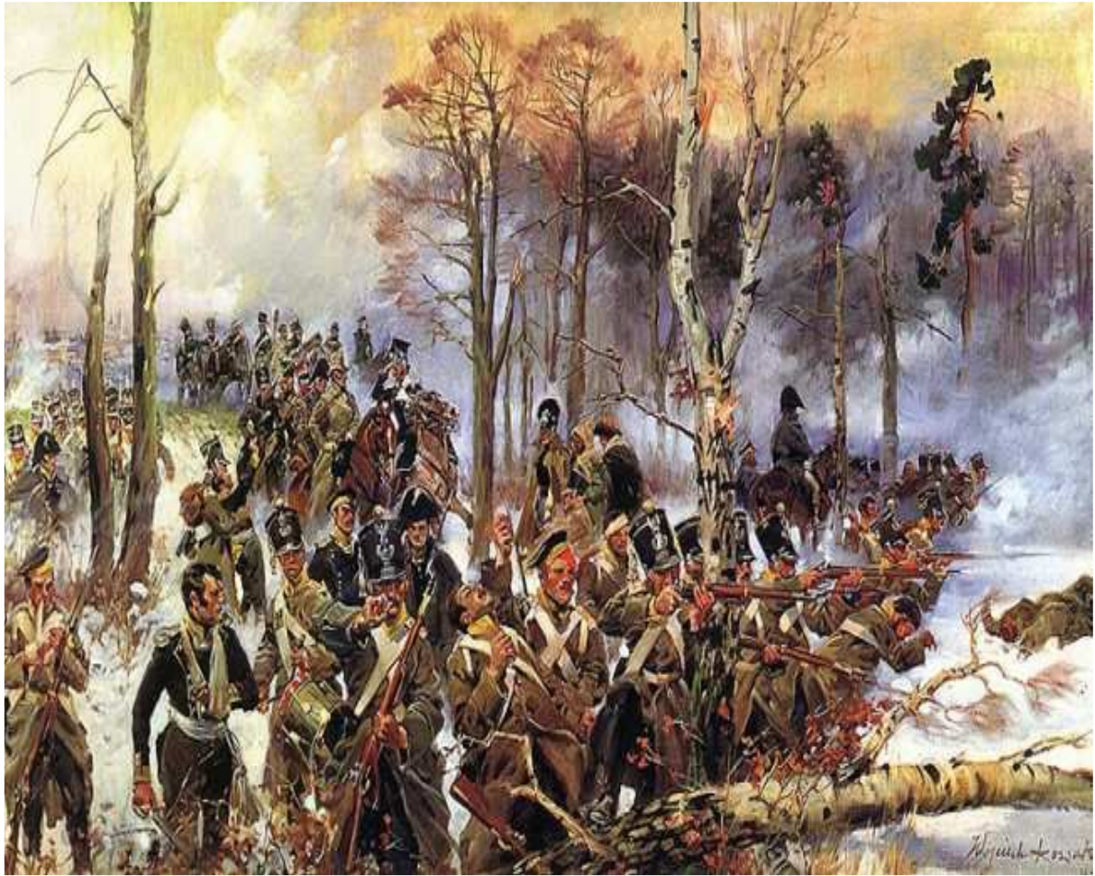
Wojciech Kossak Olszynka Grochowska

Autor umieścił na pierwszym planie grupę „czwartaków” odpierających atak rosyjski. Na twarzach żołnierzy i oficerów pułku, który okrył się w tym boju nieśmiertelną sławą, maluje się determinacja, ale i spokój mimo ponoszonych ogromnych strat.