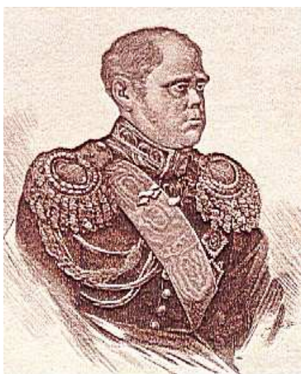
Wielki książę Konstanty Pawłowicz

Następnego dnia, wraz z uzbrojoną ludnością cywilną, opanowali stolicę. W ten sposób spisek wojskowy przekształcił się w powstanie. Wielki książę Konstanty z częścią wiernych mu generałów i wojsk wycofał się z Warszawy do karczmy na Wierzbnie, nie podejmując działań przeciwko powstańcom (w 1831 r. zmarł na cholere, według innej wersji został otruty).