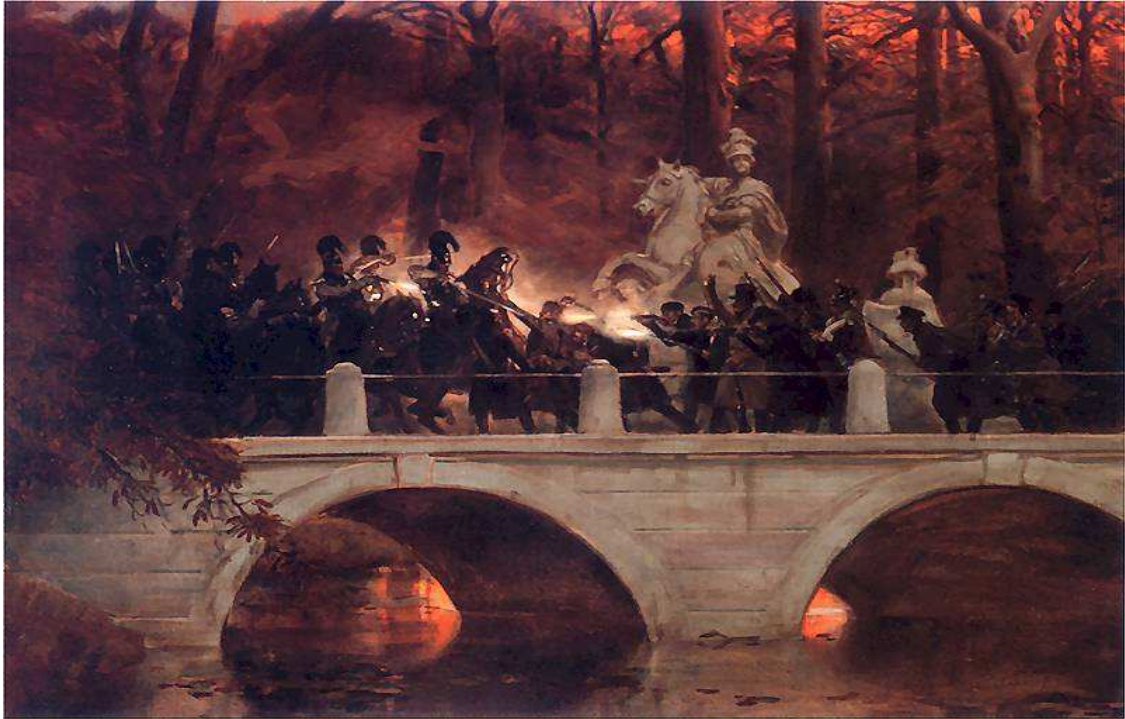
Wojciech Kossak Starcie belwederczyków z kirasjerami rosyjskimi na moście w Łazienkach