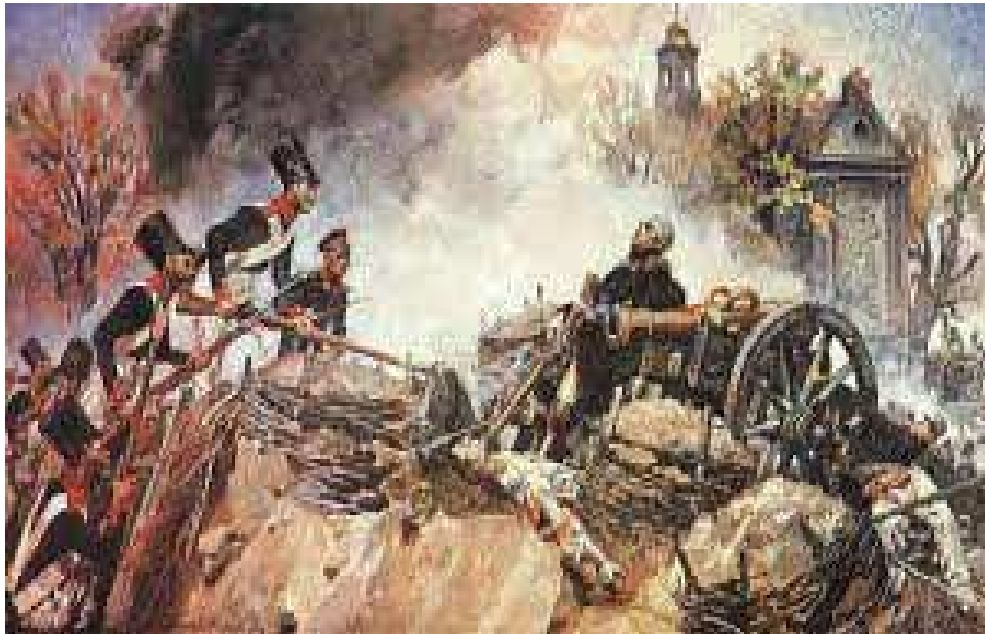
Wojciech Kossak Śmierć gen. Józefa Sowińskiego na szanicach Woli (W tle obrazu widać częściowo zasłonięty drzewami kościół św. Wawrzyńca)